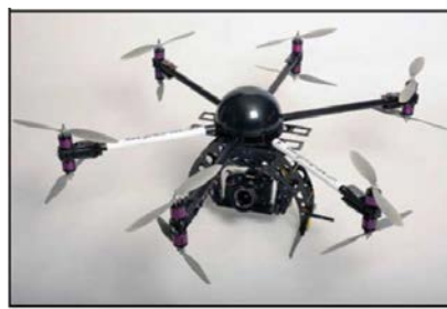
Вертолетного типа (многомоторные)