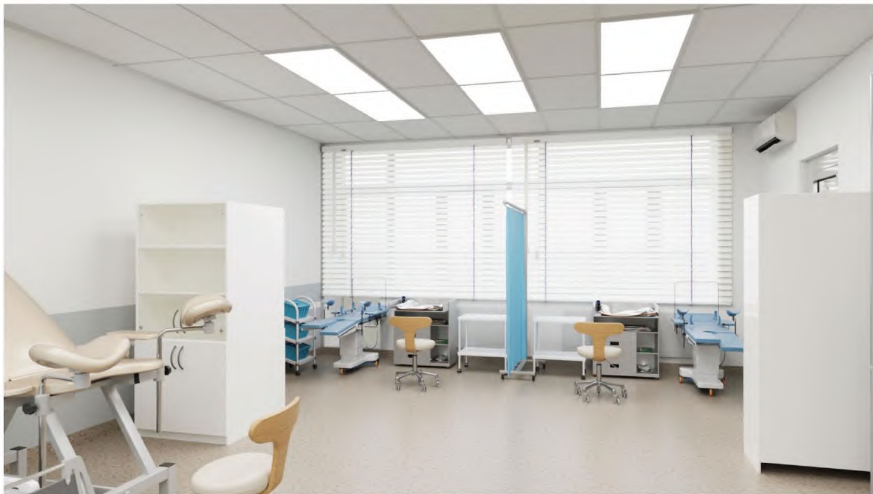
Зона под вид работ "Оказание медицинской помощи в период беременности, родов, послеродовый период и с распространенными гинекологическими заболеваниями" Помещение 22,15 (22). Визуализация 1