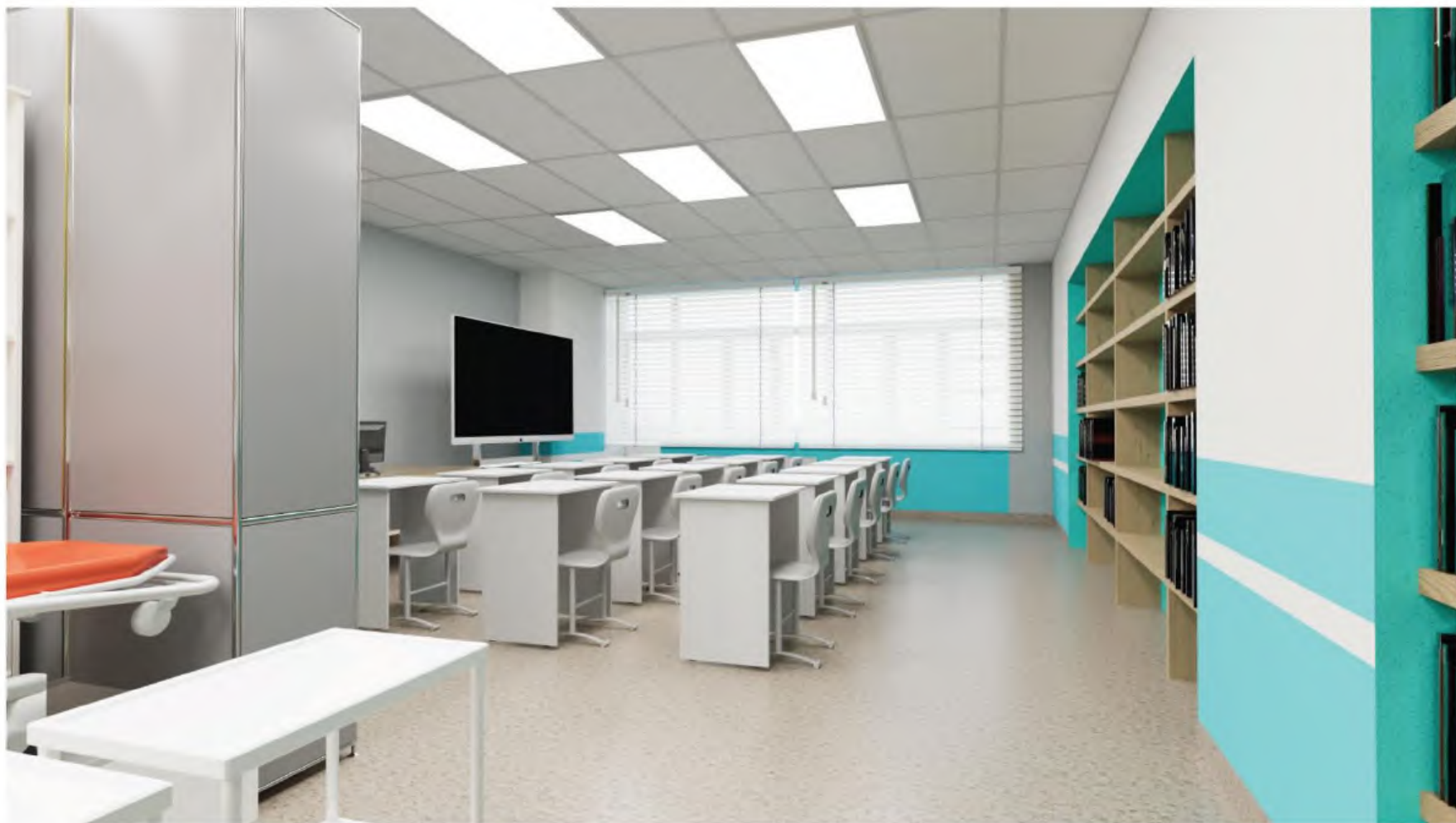
Зона под вид работ "Оказание скорой медицинской помощи в экстренной и неотложной формах, в том числе вне медицинских организаций". Помещение 14 (визуализация 1)