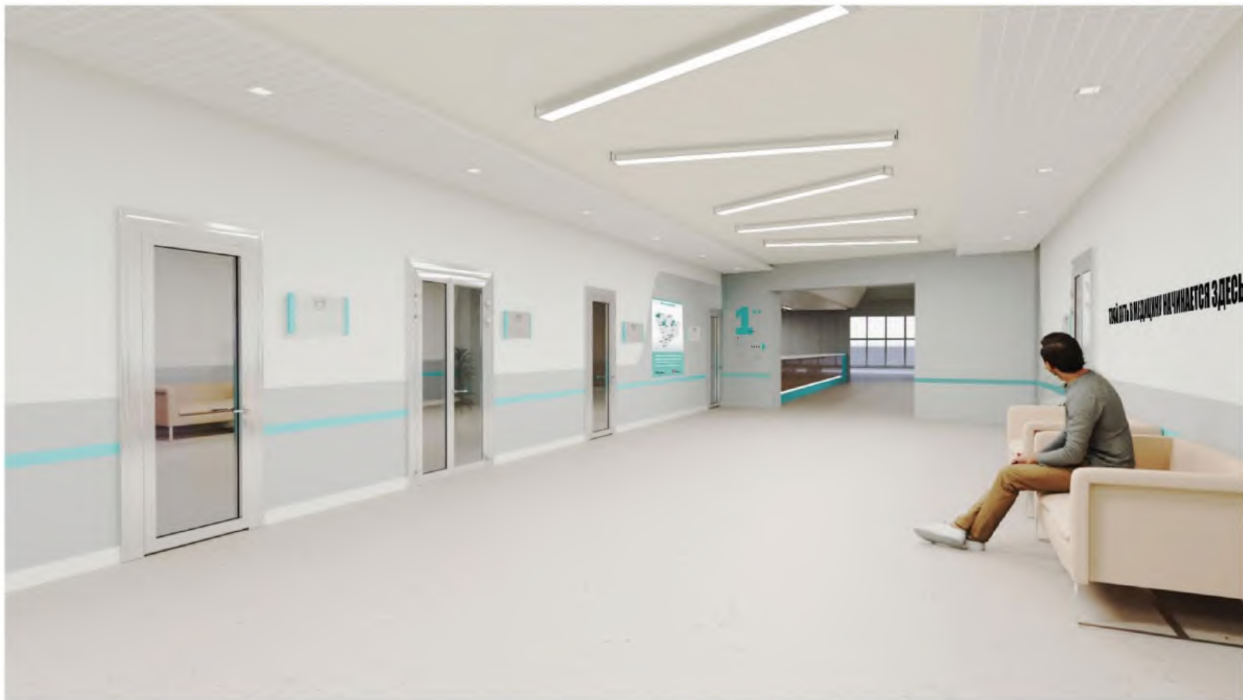
Помещение 72, (Визуализация 3)