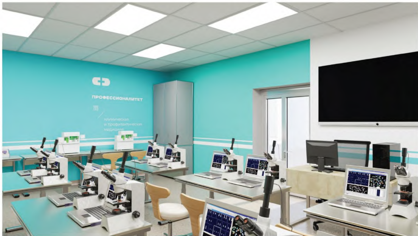
Зона под вид работ "Выполнение клинических лабораторных исследований первой и второй категории сложности". Пациенты 42,43(43). Визуализация 3