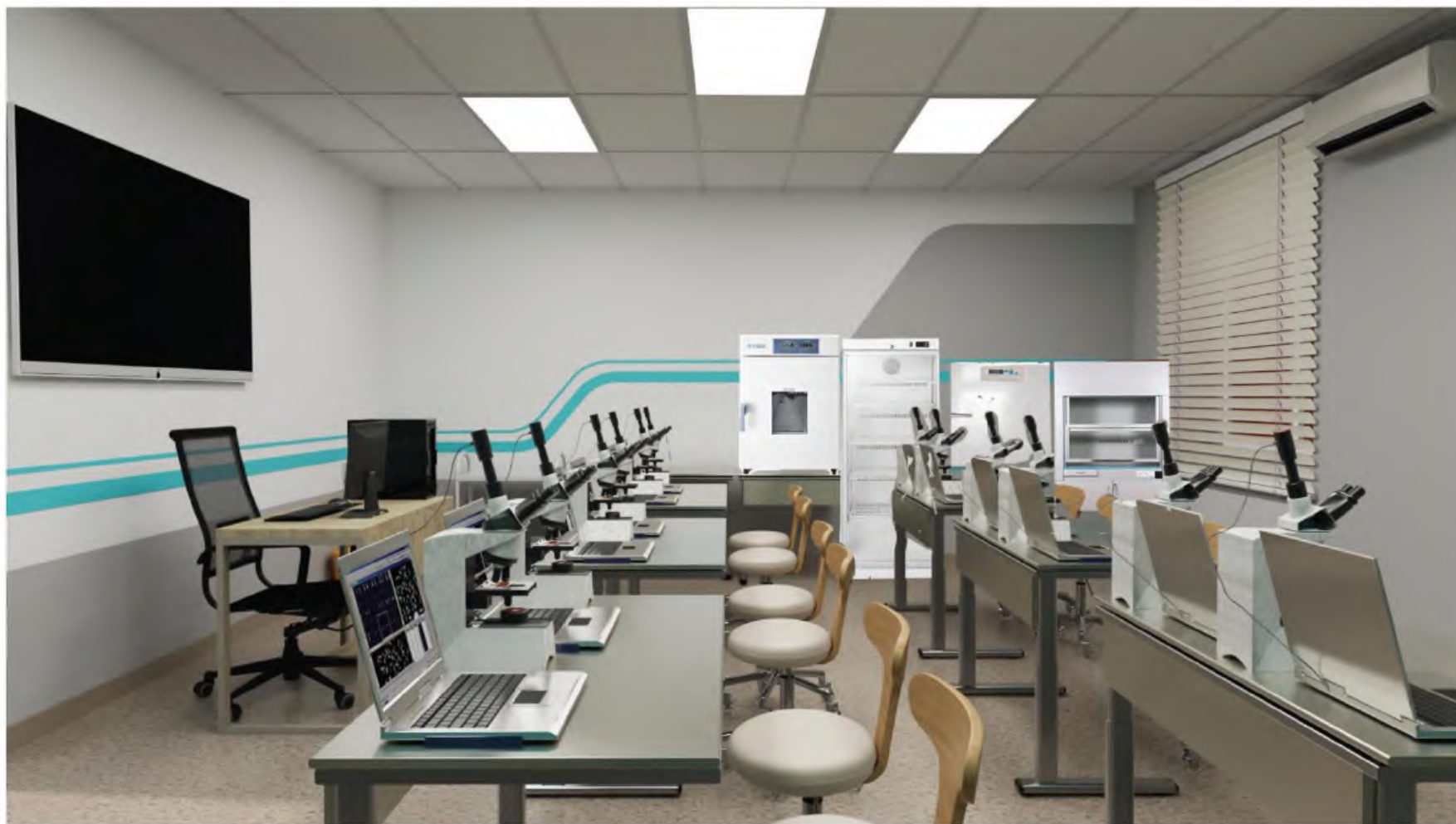
Зона под вид работ: "Выполнение клинических лабораторных исследований первой и второй категории сложности". Помещение 42,43(43). Видеонаблюдение 1