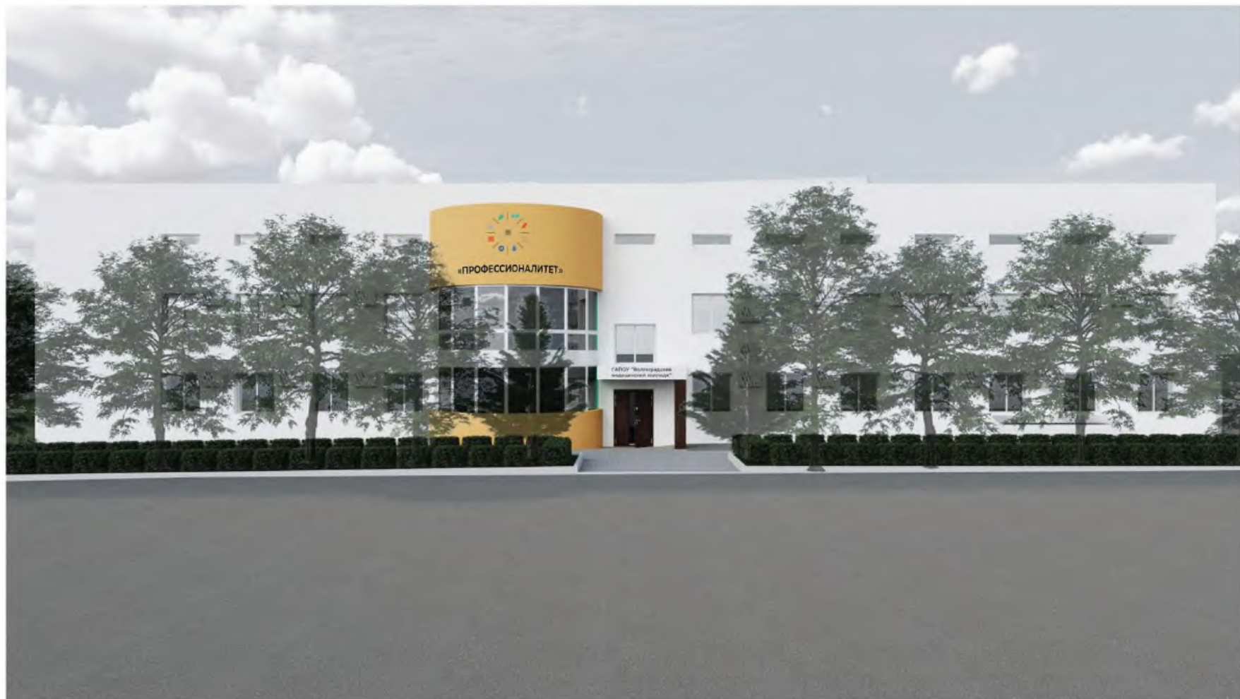
Фасад с входной группы (визуализация 1).