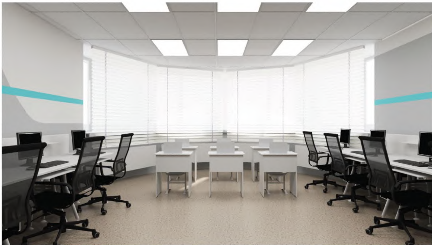
Зона под вид работ "Осуществление организационно-аналитической деятельности". Помещение 3 (визуализация 2).